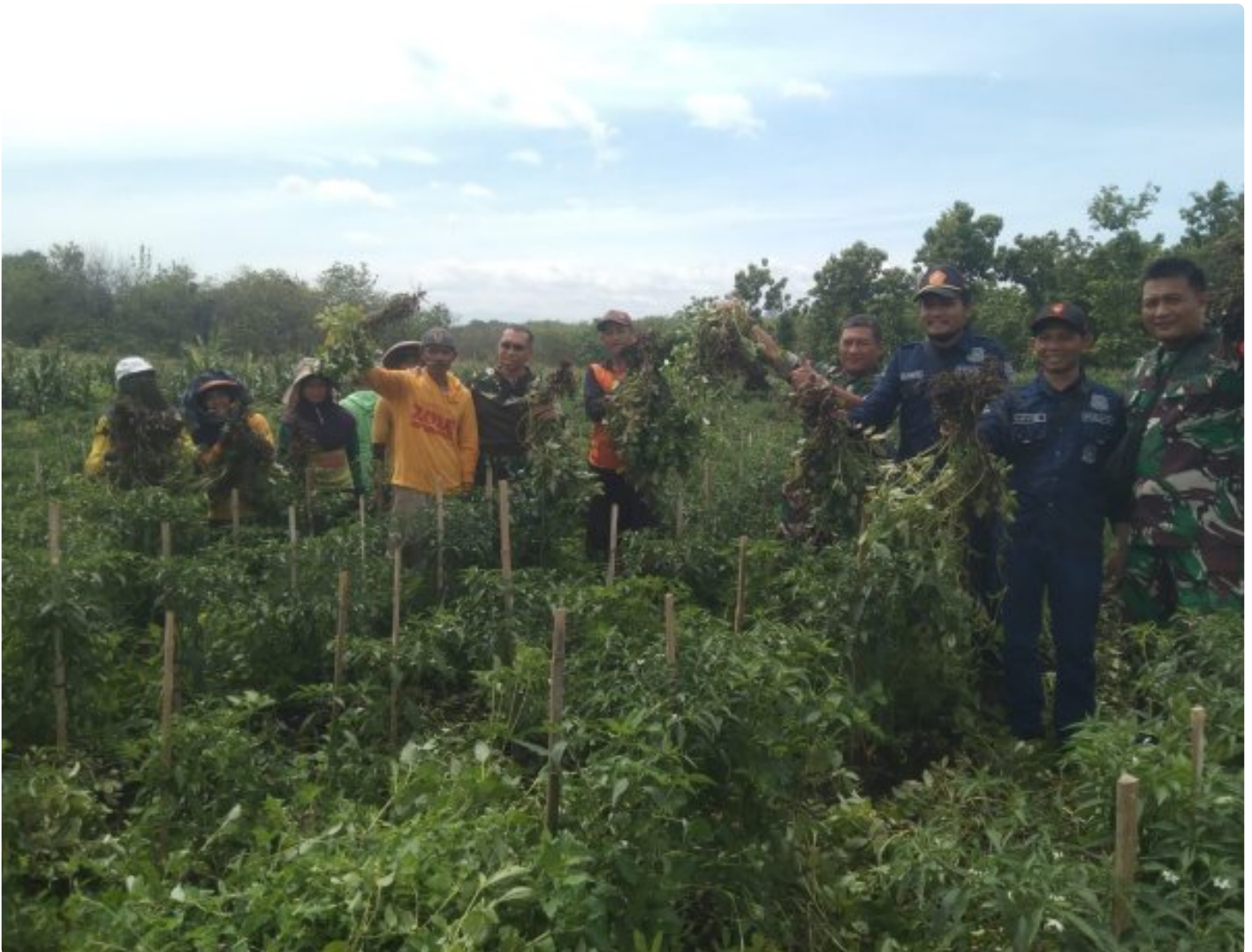
Dandim 0804/Magetan Bersama Dinas Perhutani Melaksanakan Peninjauan Perluasan Area Tanam