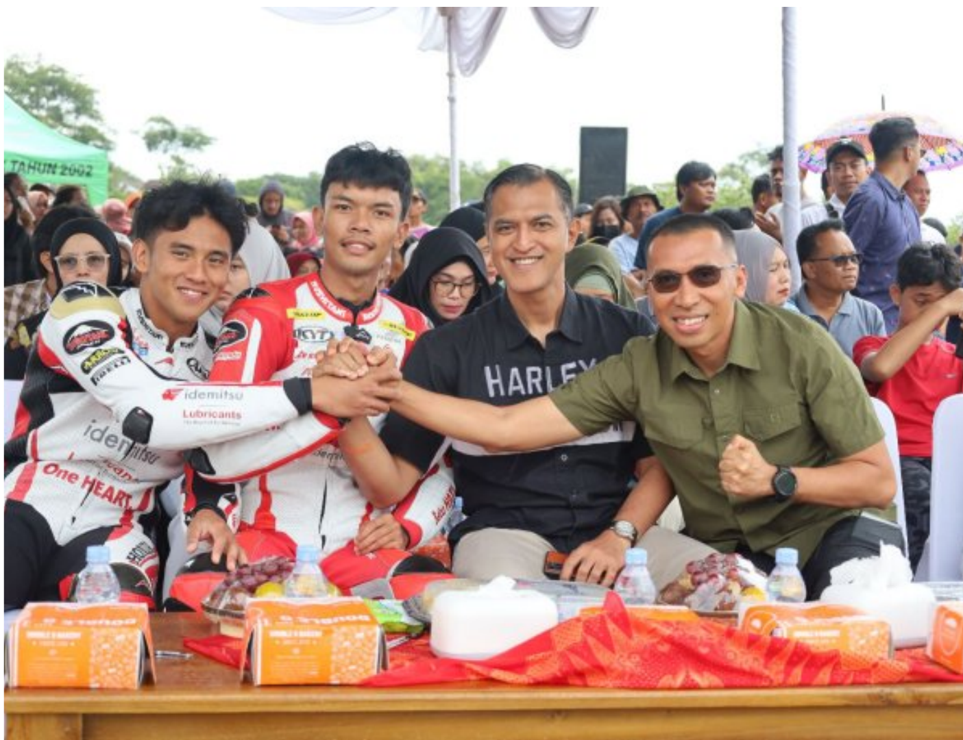
Dandim 0804/Magetan Hadiri Undangan Tinjau Sirkuit Magetan