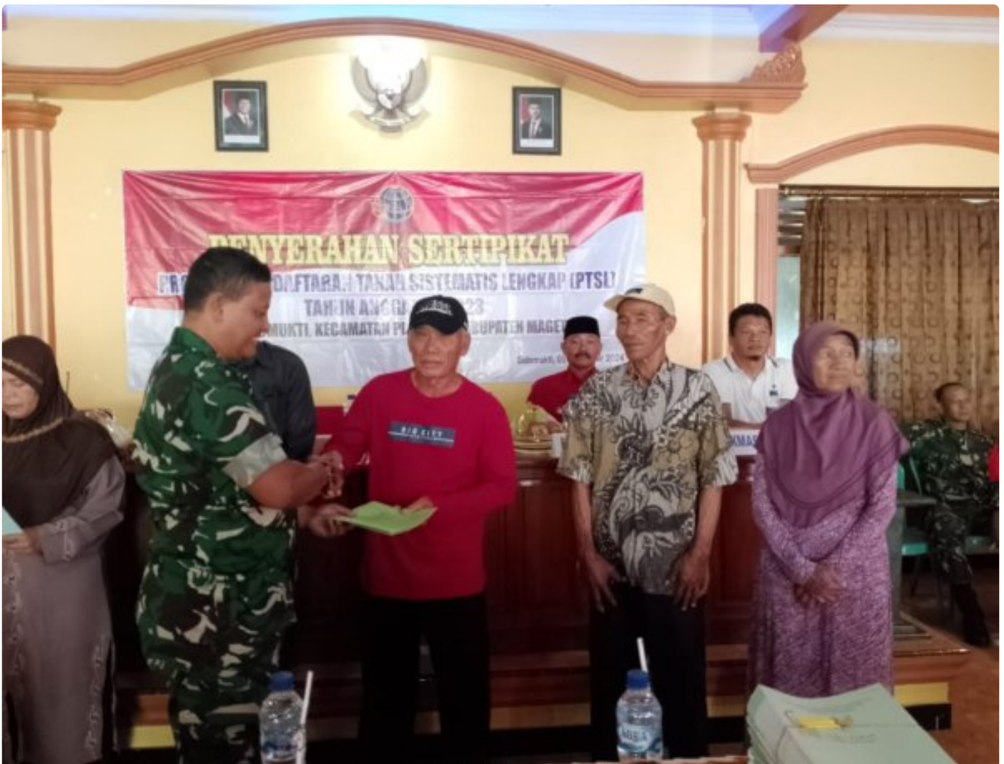
Danramil 0804/02 Plaosan Hadiri Penyerahan Sertifikat Program Pendaftaran Tanah Sistematis Lengkap (PTSL) Desa Sidomukti

PLAOSAN. - Desa Sidomukti melalui Badan Pertanahan Nasional (BPN) melakukan penyerahan Sertifikat Tanah Program Pendaftaran Tanah Sistematis