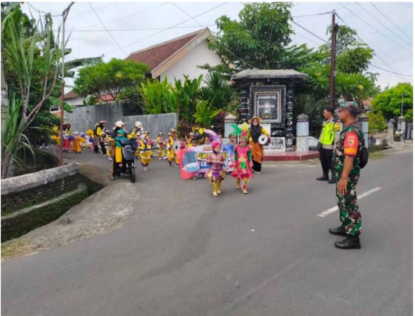
Gebyar Rojabiyah RA dan MI, Babinsa bersama Bhabinkamtibmas Amankan Jalannya Kegiatan Parade Drum Band